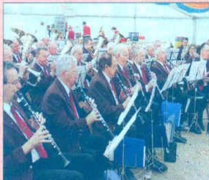
Konzert im Hoffmannhaus: Das Stadtwerke-Orchester ist mit von der Partie.