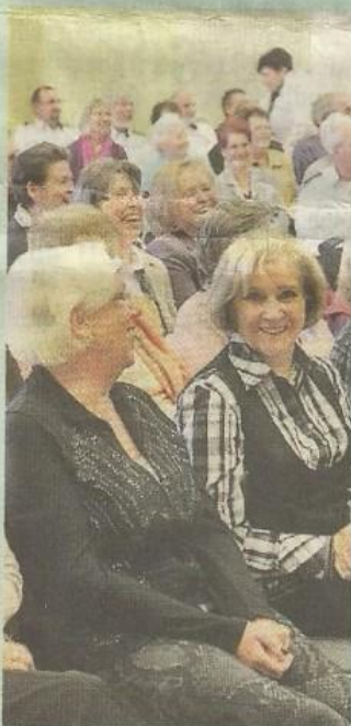
Mehrzweckhalle: Ausverkaufter Saal in Westhagen.

Maritimer Chor Wolfsburg lud zum Frühlingssingen ein