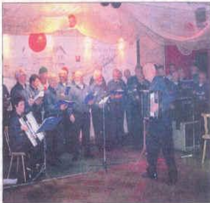
Erfolgreiche Sänger: Den Maritimen Chor Allersee erwarten wieder attraktive Auftritte, darunter bei der Landesgartenschau.