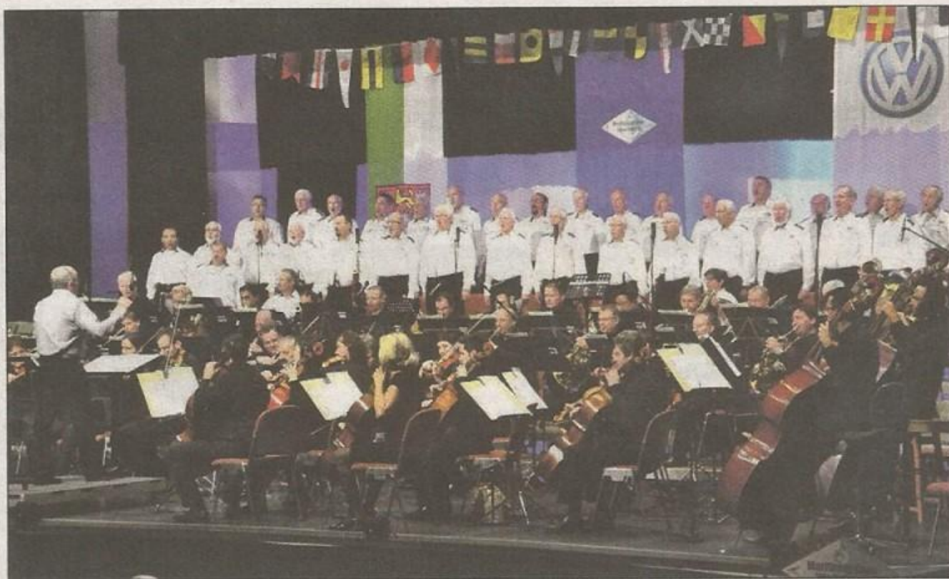
Der Maritime Chor Wolfsburg und das Philharmonic Volkswagen Orchestra musizierten gemeinsam bei einem Konzert im CongressPark.

Chor und Orchester: 1.500 Gäste erlebten Zusammenspiel