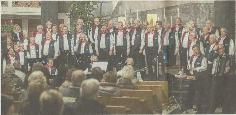
Der Maritime Chor Wolfsburg gab in der Kreuzkirche ein Benefizkonzert.

Weihnachten auf hoher See und im Hafen hat der Maritime Chor so stimmungsvoll besungen. Die Lieder kamen an und begeisterten. Sänger wie Zuhörer hatten ihre Freude daran.