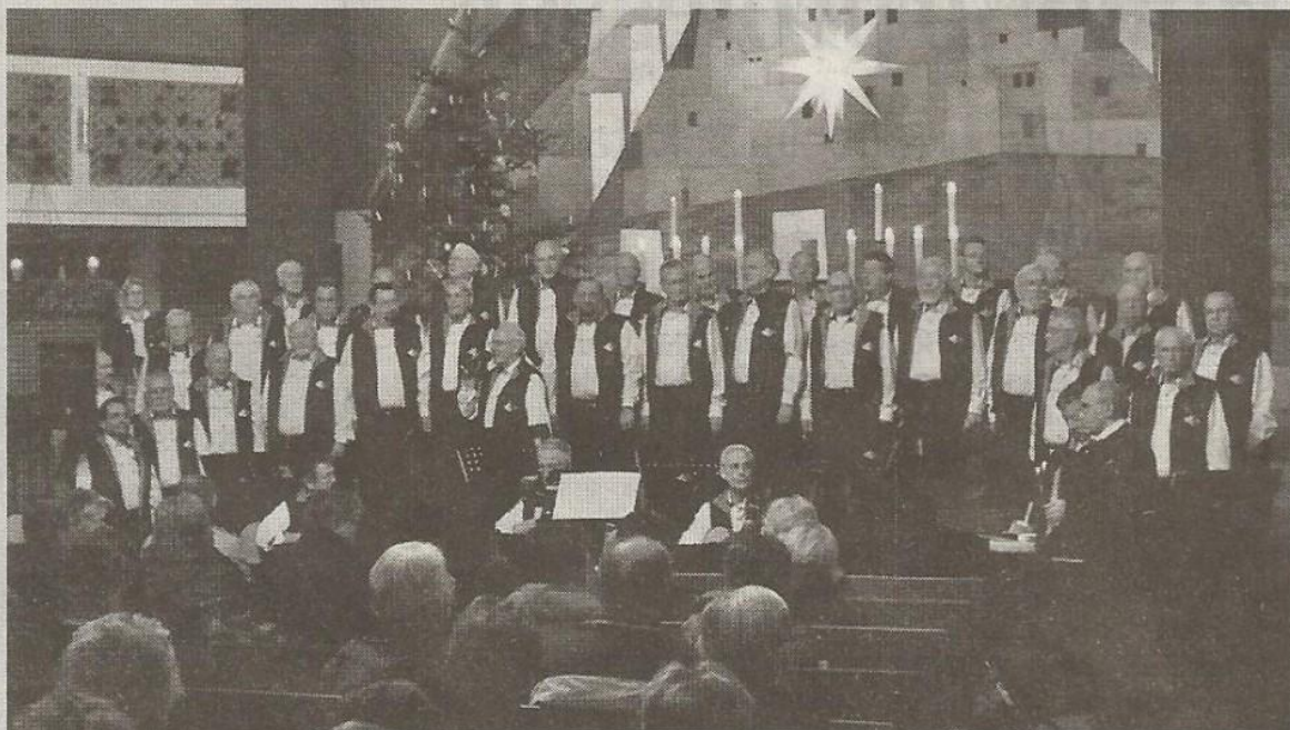
Weihnachtlich: Die Sänger des Maritimen Chores gaben in der Kreuzkirche ein Konzert zugunsten der Telefonseelsorge.