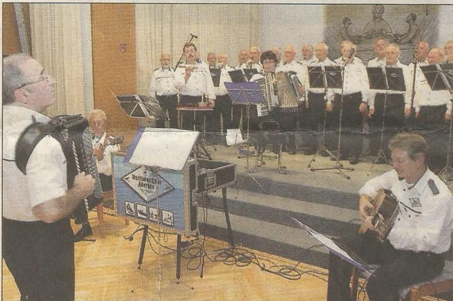
Von der Weite der Meere sang der Maritime Chor Allersee und begeisterte damit die Zuhörer im Wichersaal.