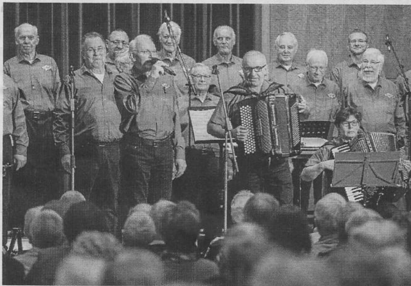
Der Maritimen Chor gab sein Adventskonzert mit dem Jugendchor Fallersleben und dem deutsch-russischen Chor Inspiration.