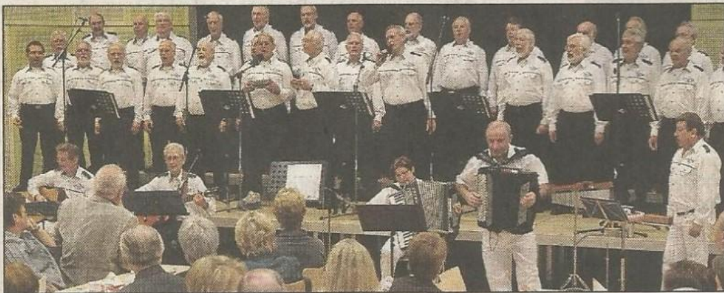
Der Maritime Chor Wolfsburg.