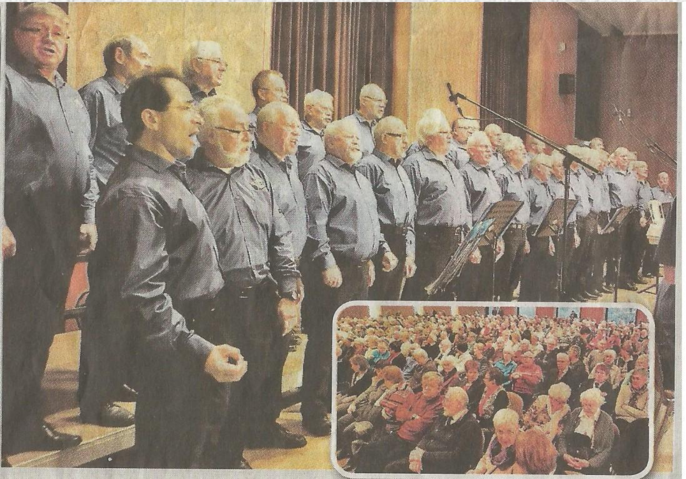
Stimmgewaltiger Auftritt: 500 Besucher genossen im CongressPark das Adventskonzert des Maritimen Chores und seiner zwei Gastchöre.