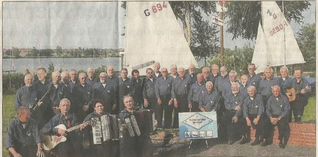
Der Maritime Chor Allersee freut sich auf das Internationale Shantychor-Festival auf der Ostsee.