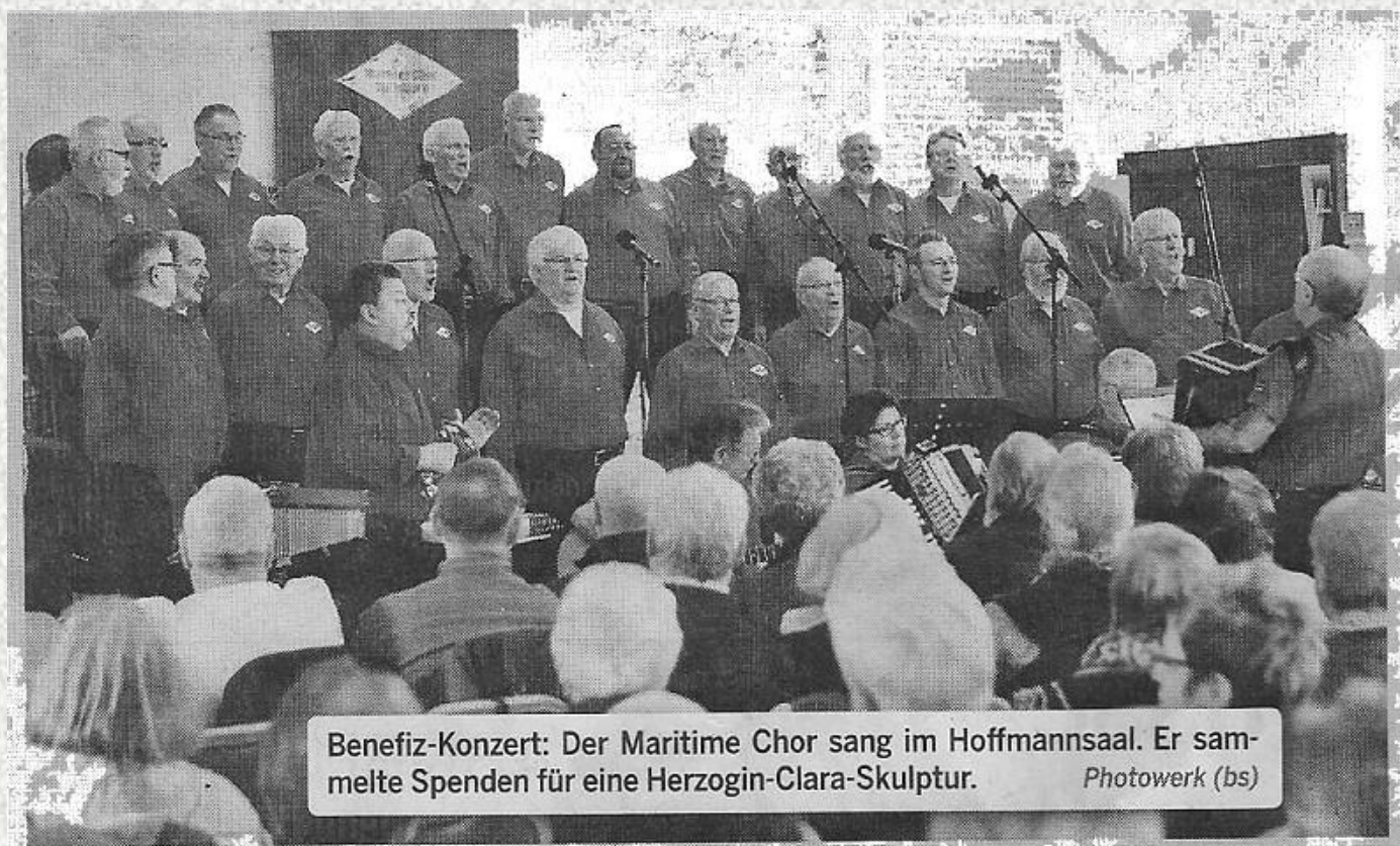
Benefiz-Konzert: Der Maritime Chor sang im Hoffmannsaal. Er sammelte Spenden für eine Herzogin-Clara-Skulptur.