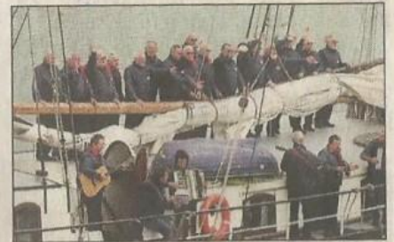
Der Maritime Chor Allersee sang beim Shanty-Festival.

derlanden und Großbritannien tourten auf zehn Schiffen für eine Woche entlang der Ostseeküste. In Heiligenhafen im Fischereihafen boten die rund 250 Sänger auf den Segelbooten einen beeindruckenden Anblick. 7000 Zuschauer spendeten Applaus. Auch beim Auslaufen mit der „Skylge“ sangen die Wolfsburger und erhielten tosenden Beifall. Ein weiteres gemeinsames Konzert fand unter anderem in Laboe statt.