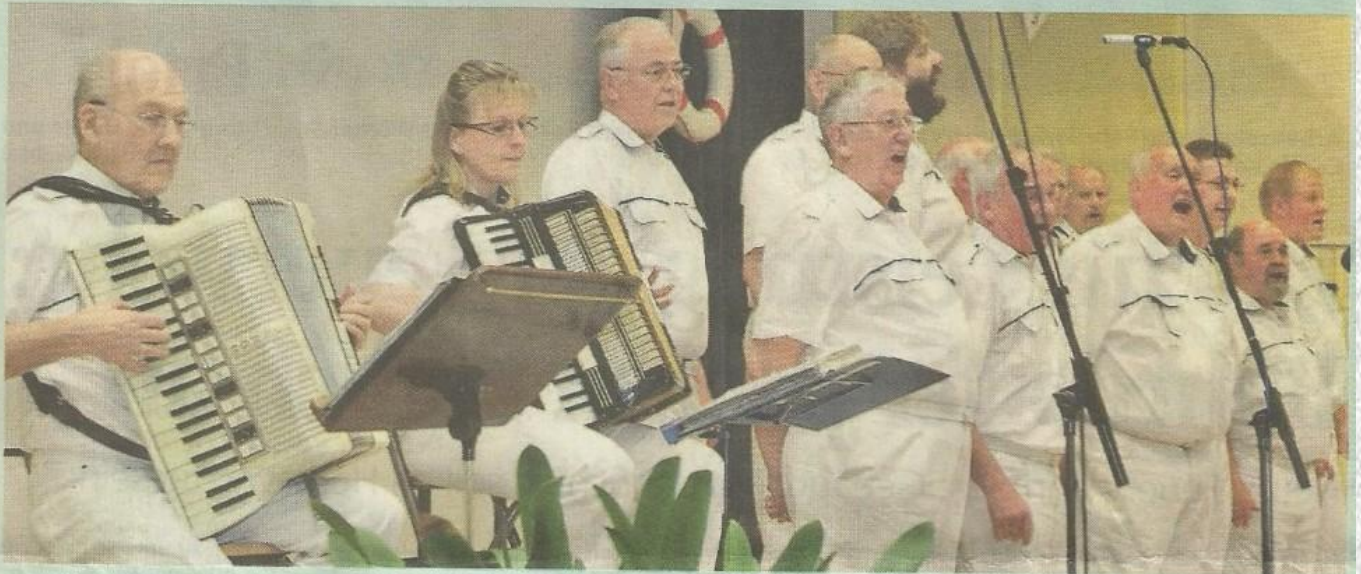
Geburtstags-Konzert in Westhagen: Der Maritime Chor hatte eingeladen.