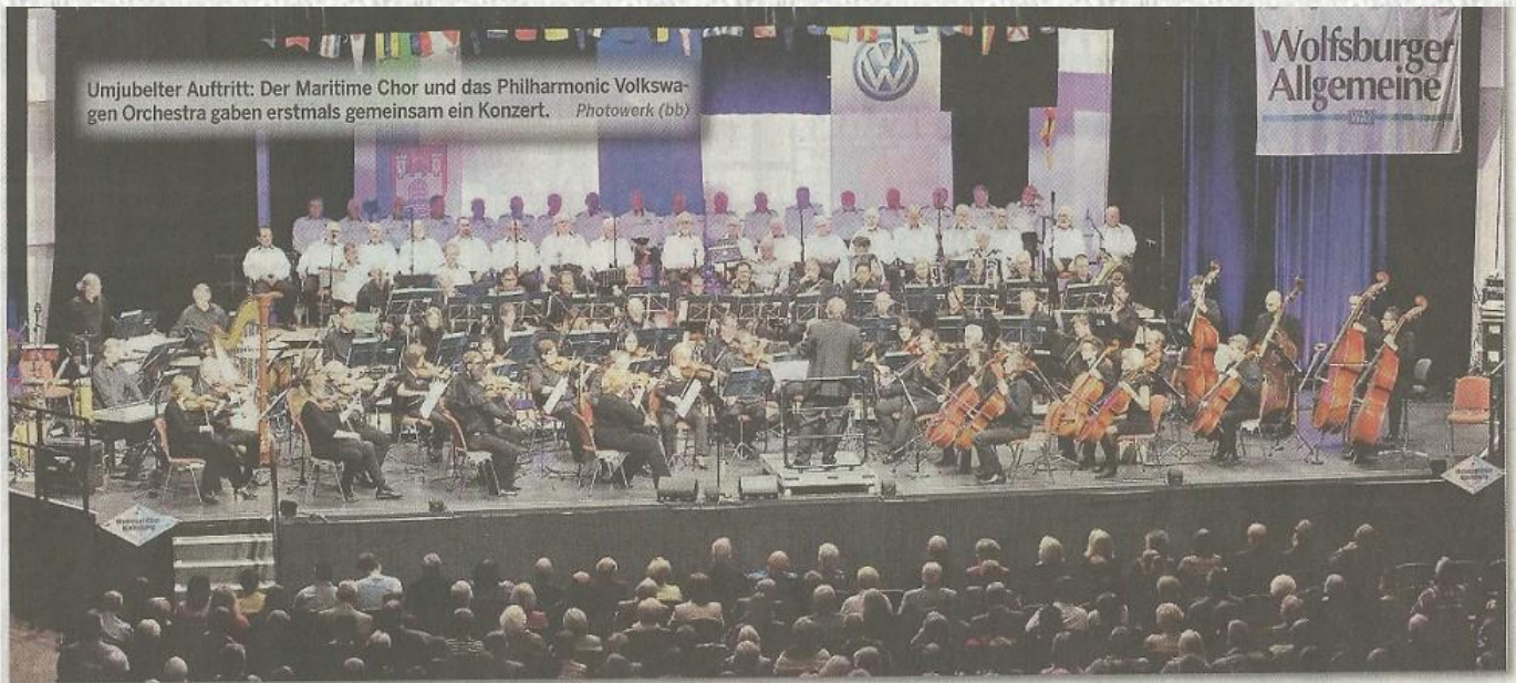
Umjubelter Auftritt: Der Maritime Chor und das Philharmonic Volkswagen Orchestra gaben erstmals gemeinsam ein Konzert.