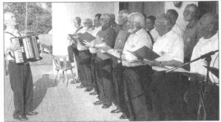
der Maritime Chor Allersee.

Hafenfest“, verspricht von Hartz. „Und die Stadt hat nun die Genehmigung erteilt, dass Yachten zum Fest am Hafen anlegen dürfen. Außerdem wird das ULG-Gelände für das Hafenfest noch befestigt.“