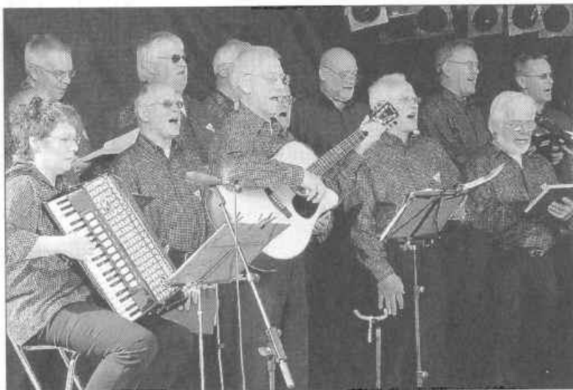
Der Maritime Chor Allersee sang für das Publikum am Nachmittag.

Höhepunkt der Festtage wird wiederum das Großfeuerwerk „Kanal in Flammen“ sein, das diesmal am Sonntagabend steigt.