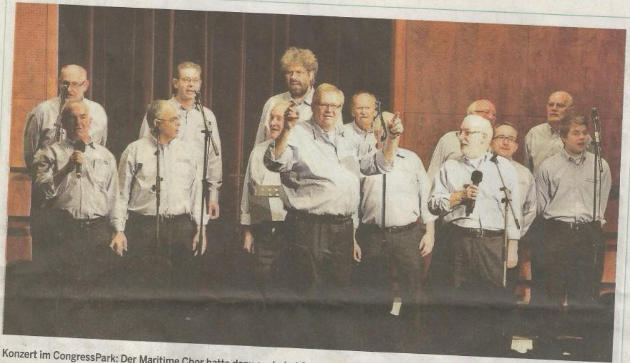
Konzert im CongressPark: Der Maritime Chor hatte dazu auch drei Gastchöre eingeladen.