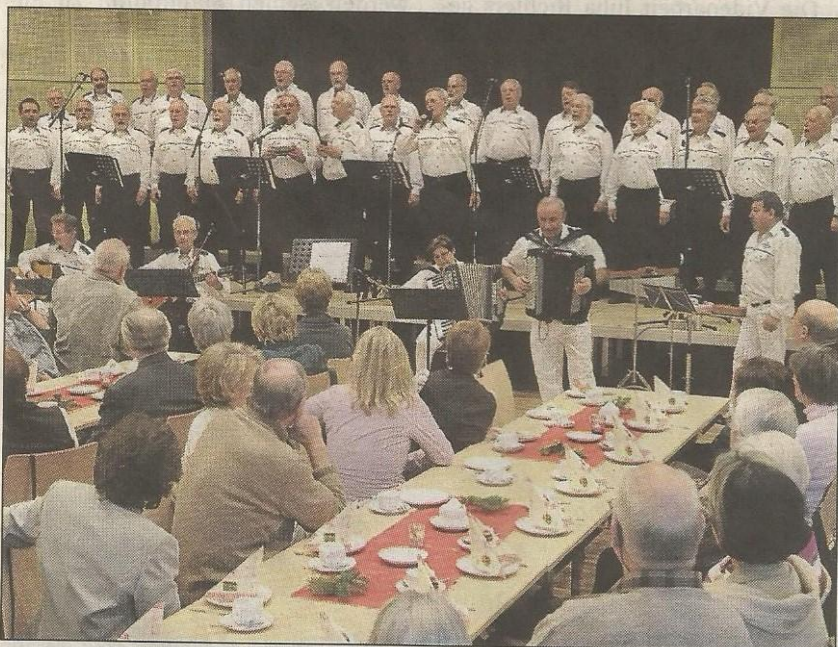
Der Maritime Chor Wolfsburg singt in Westhagen Lieder von der See, von Matrosen und Bräuten im Hafen.