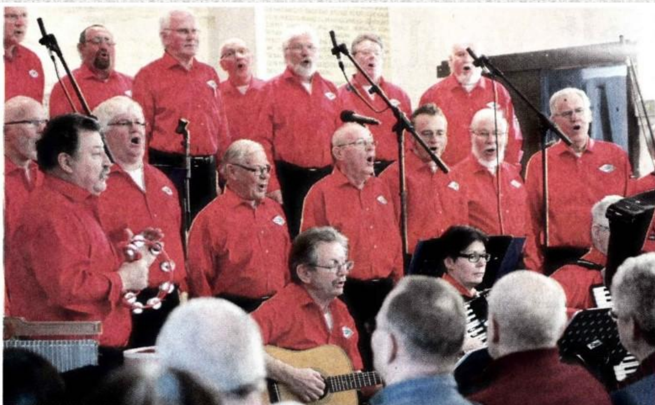
Der Maritime Chor beim gestrigen Auftritt.