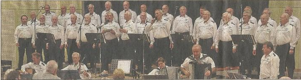
Auch Weihnachtslieder der Seeleute trug der Maritime Chor in Westhagen vor.