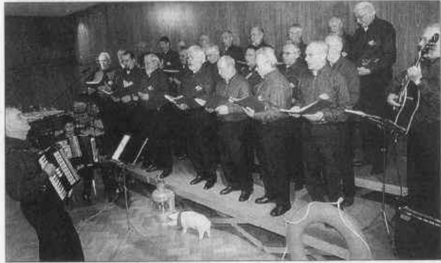
Geburtstagskonzert: Der Chor der Allensee-Vereine sang beim Kulturverein.